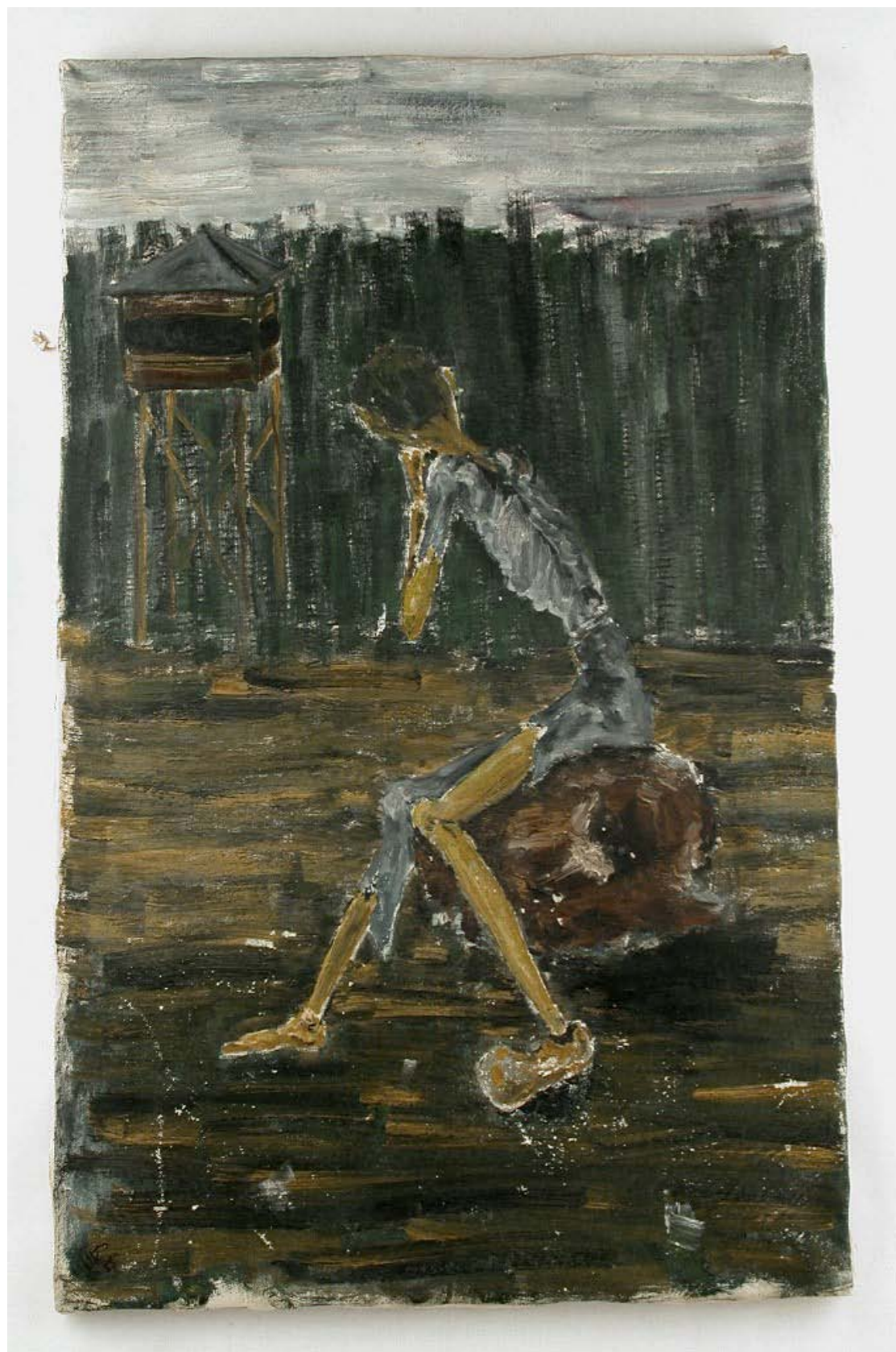
ראול טייטלבוים: נעורים בברגן בלזן שמן על בד, 40X60, 1949 (המקור נמצא באוסף של יז ושם בירושלים)