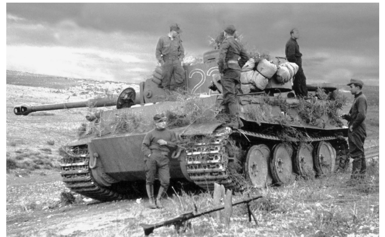
טנק טייגר בטוניסיה, דצמבר 1942